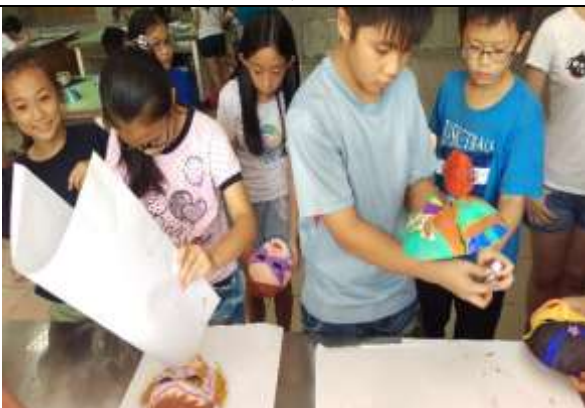
學生製作面具時專注的表情