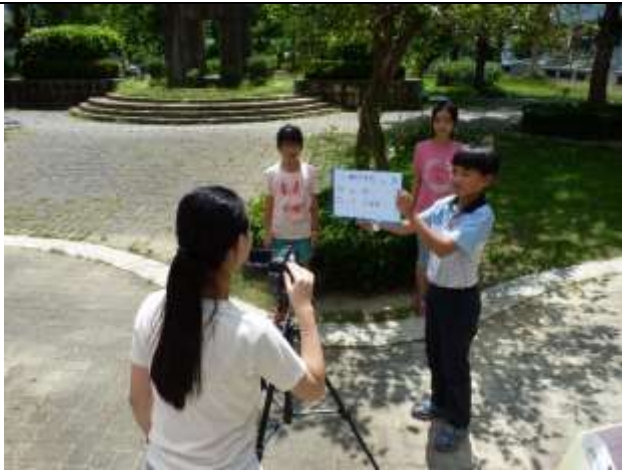
由學生自編自導取景拍攝影片