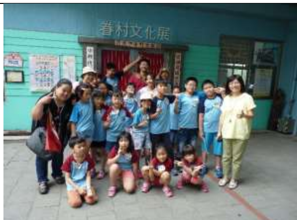
走訪南瀛眷村文化區