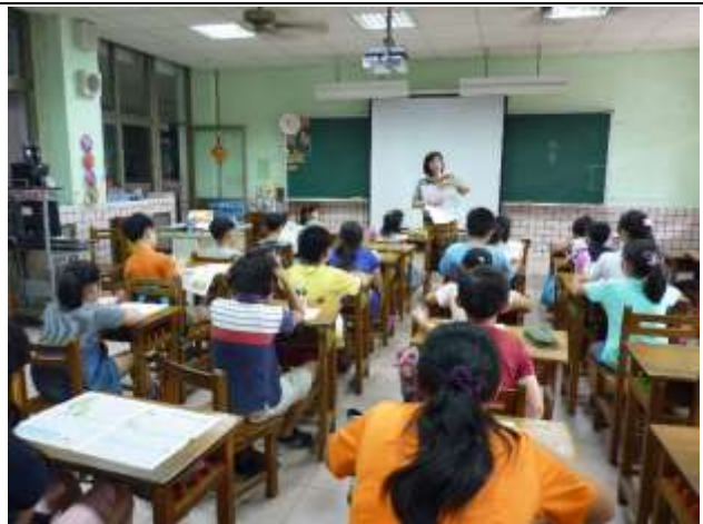
由老師指導如何編寫角本