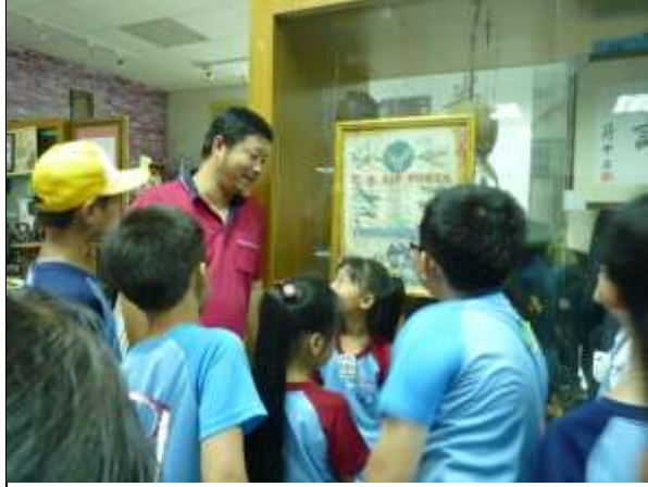
學生聚精會神的聆聽里長的介紹