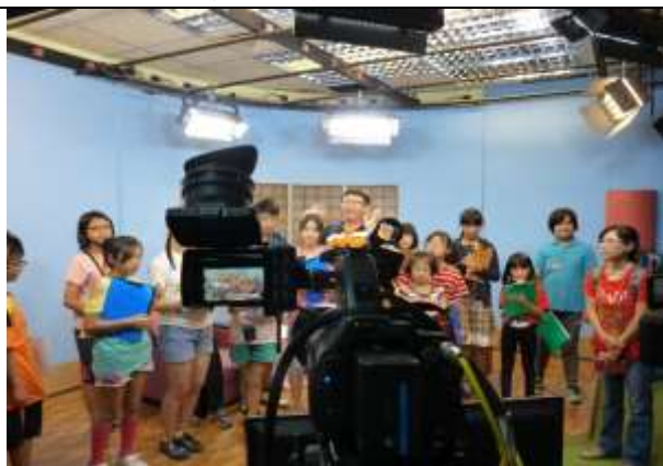
學生參訪南天電視台