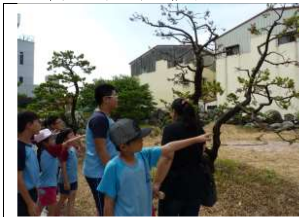
學生參訪千年老樹