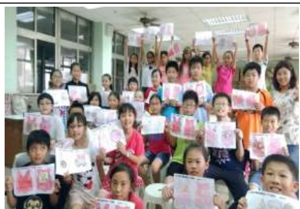
學生自製隊徽的成果