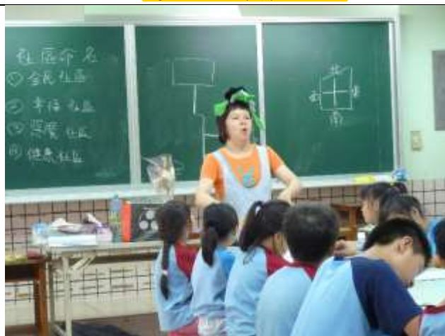
請巫婆媽媽說關於「十二婆姐」的故事