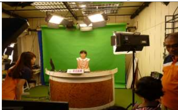
讓學生體驗登上主播台播報新聞