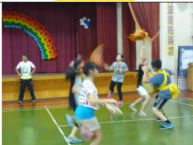
老師指導學生跳鼓招式