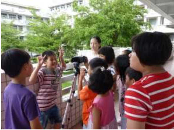
學生體驗拍片的樂趣