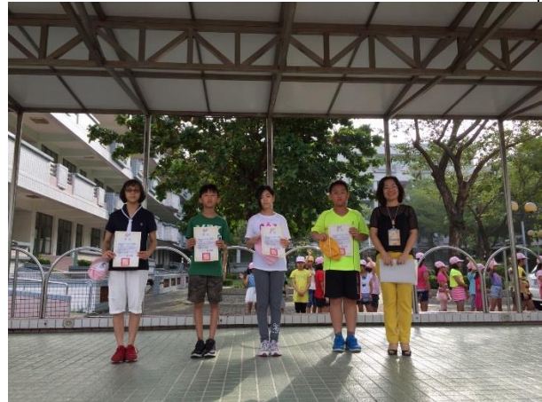
前三名與校長合影