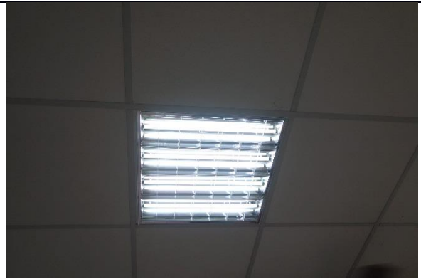
說明：T5的燈具亮度明顯較亮