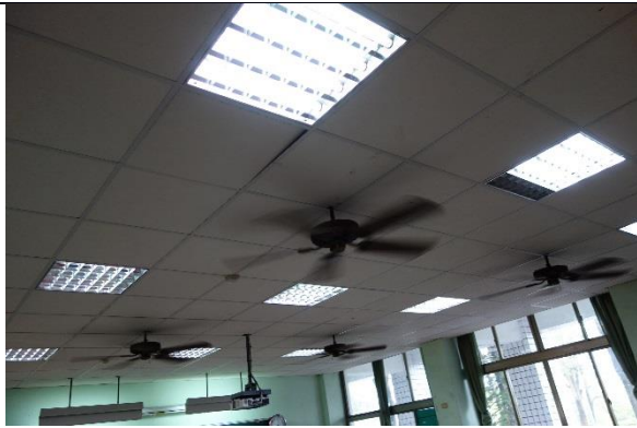
說明：T8的燈具較耗電且不明亮