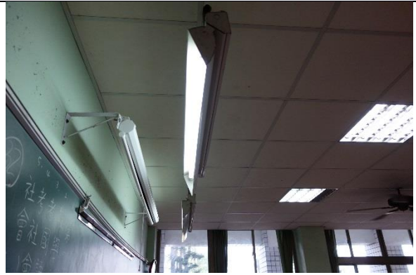
說明：黑板燈也是 T8燈具