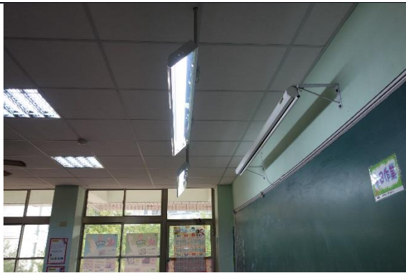
說明：黑板燈改為 T5燈管