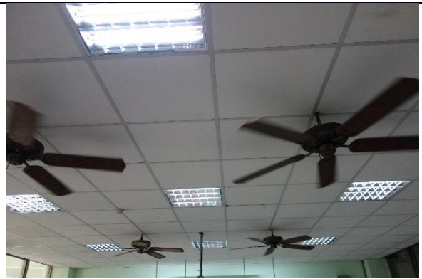
說明：整間教室明亮許多