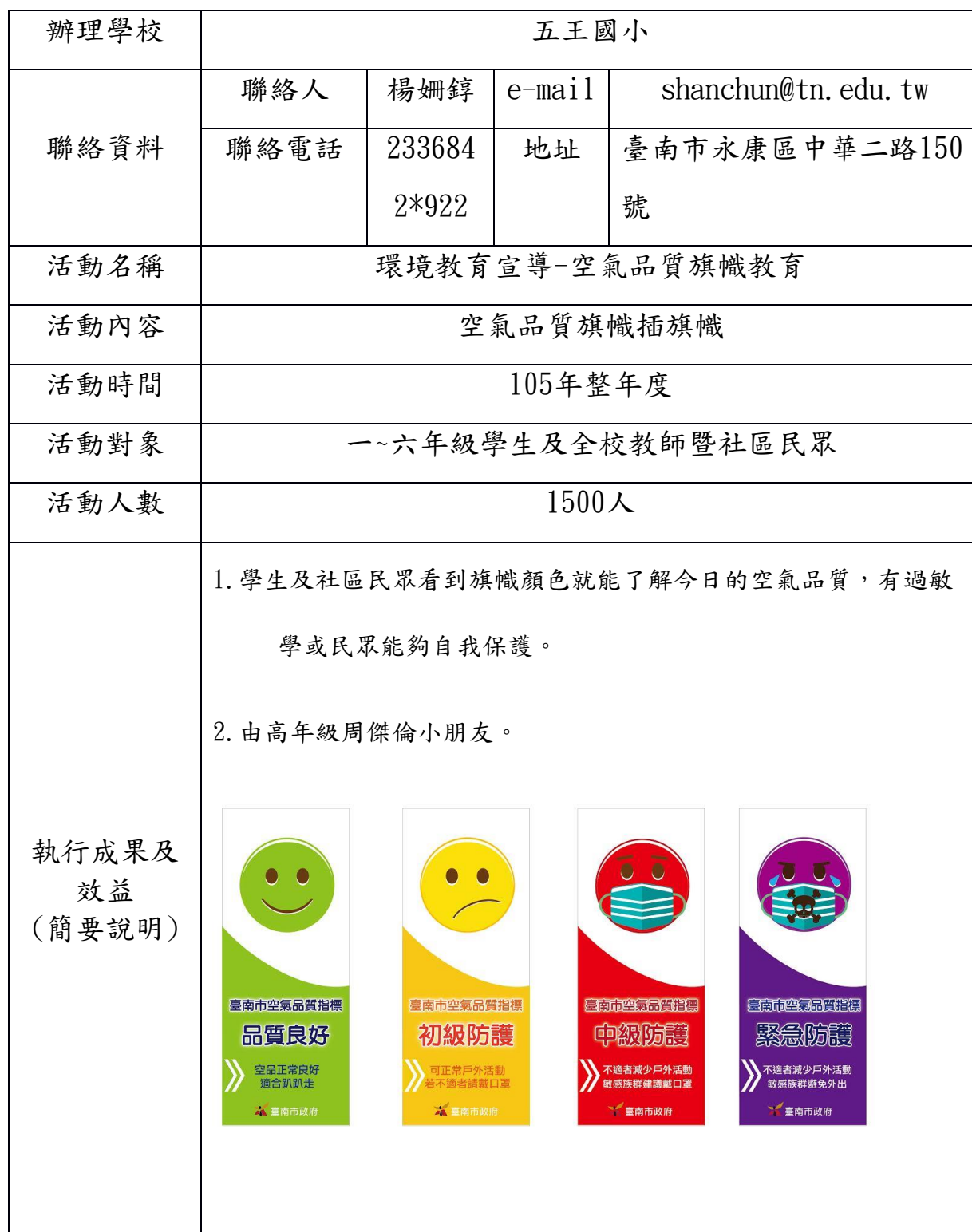
105年度臺南市國中小環境教育宣導活動執行成果表