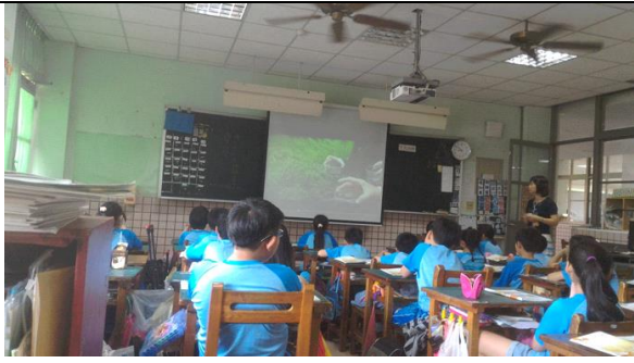
說明：欣賞環境影片