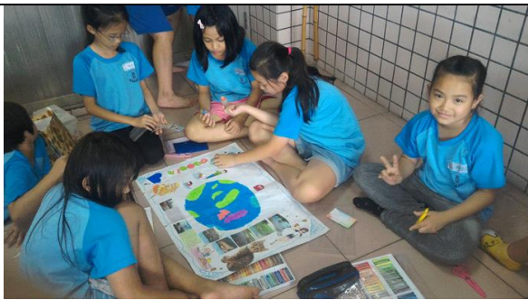
說明：製作保衛地球海報