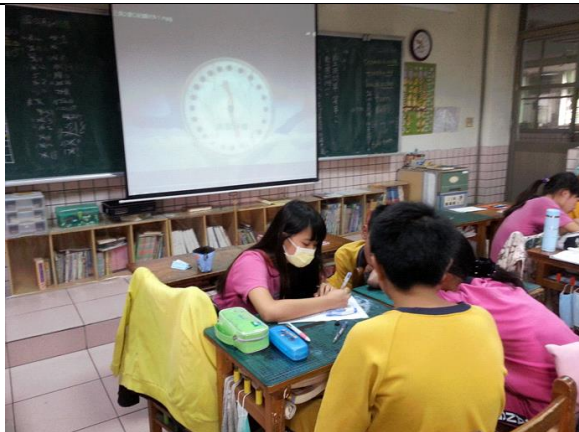
說明:欣賞環境影片